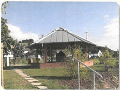
Antoniusbrunnen in Rückershausen